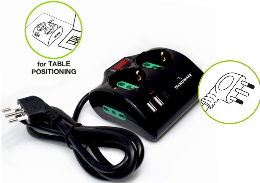
for TABLE POSITIONING